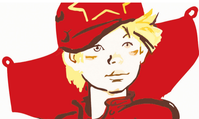
Рисунок из сети интернет