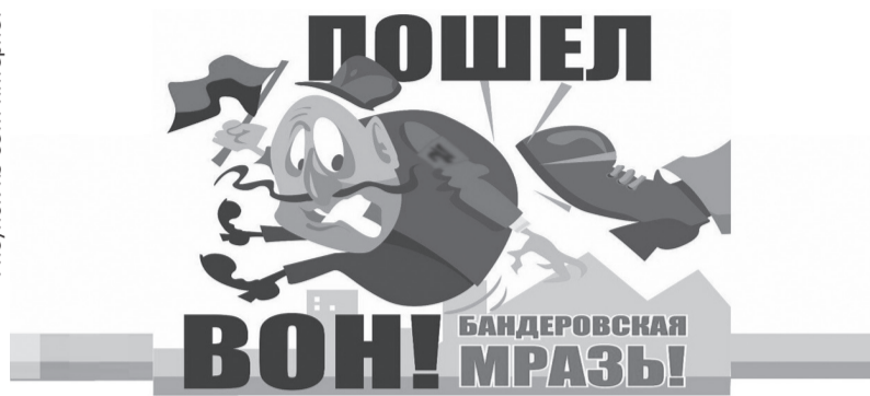
Рисунок из сети интернет

Согласно ежедневным сводкам Минобороны РФ, 1 мая уничтожили суммарно 241 дрон противника, из них 141 дрон сбит в ночное время.