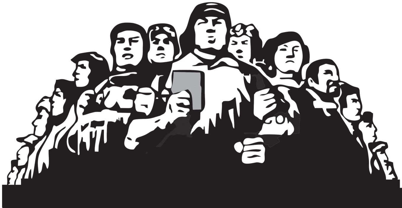
Рисунок из сети интернет

«Историческая миссия рабочего класса, как класса единственно способного возглавить построение общества без эксплуатации, остается неизменной со времен Маркса и Ленина до современной эпохи».