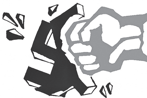
Рисунок из сети интернет

политической борьбы ещё можно было наблюдать в стране до «майданного» 2014 года, то сегодня трудящиеся если и выходят на редкие акции протеста, то в основном против роста цен и тарифов на жилье и энергию, против обесценивания пенсий и пособий. При этом сейчас гораздо меньше возможностей координировать действия трудящихся и передавать опыт политической и других форм борьбы пролетариата. Трудовой народ деморализован, многократно обманут. Миллионы людей потеряли нормальную работу, а вместе с этим утратили и всякую способность к классовой самоорганизации. Трудящиеся попросту выживают, как могут, многие вынуждены вкалывать на кабальных условиях как у себя на родине, так и всё больше за границей.