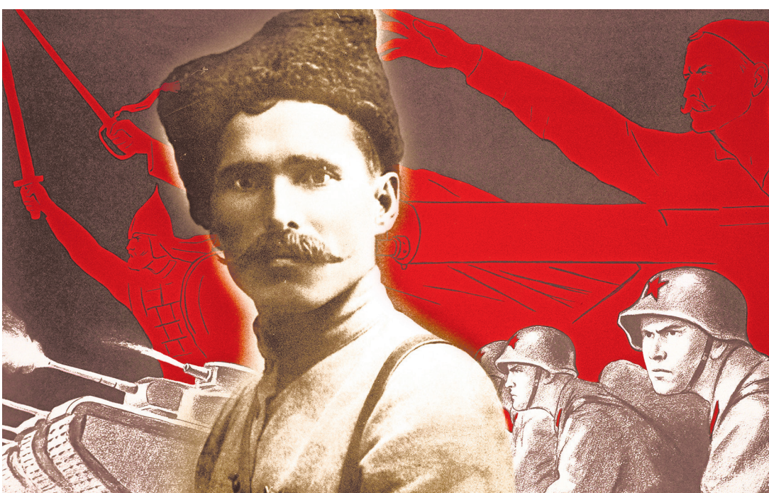
Плакаты времён ВОВ, из сети интернет

Не щадили белогонимых и сдавшихся в плен. Красноармеец