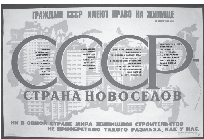
Плакаты архивен СССР.

Новая власть распорядилась однозначно: тот, кто работает, должен быть вырван из нужды и тесноты и приобщён к благам цивилизации. В одной только Москве в ноябре-декабре 1917 года было реквизировано 216 домовладений